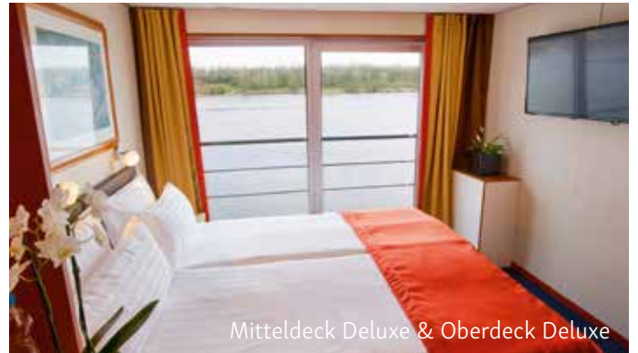
Mitteldeck Deluxe & Oberdeck Deluxe