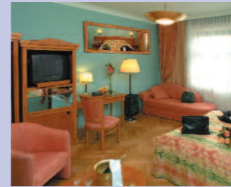
Komfortables Hotel im Zentrum der Stadt mit viel Wiener Charme.

JACKPOT Sparen Sie bis Euro -40,- pro Person, Infos auf letzter Seite