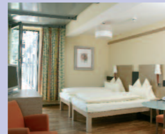
Modern mit viel Komfort in absolut bester Lage Wiens!

JACKPOT Sparen Sie bis Euro -40,- pro Person, Infos auf letzter Seite